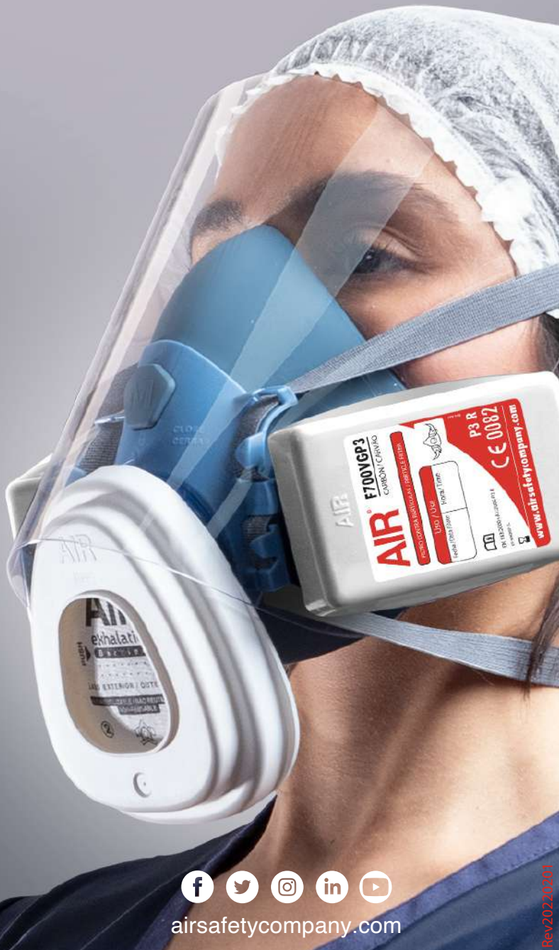
Lámina transparente de protección para el rostro y los ojos del usuario en ambientes con riesgos de exposición de aerosoles y gotículas expulsadas por terceros.